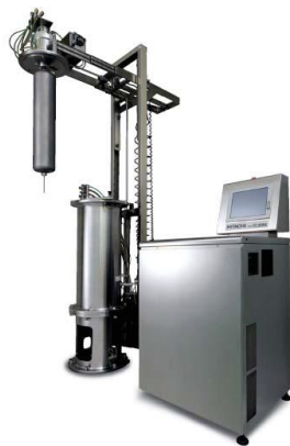
himac CC40NX SERIES

对于很多疫苗企业，通常有大量的样品需要纯化，且纯化阶段使用的离心设备常常要求要达到 100,000xg 以上的离心力，操作过程中又需要保证无污染，各个方面都要考虑，这就需要一款真正高大上的离心机来纯化抗原，以保证高品质的疫苗。下面就跟大家介绍一款大咖级别的日立公司的生产型大容量连续流超速离心机—CC40NX;